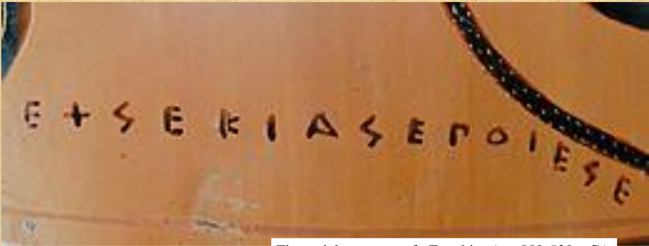
Firma del ceramografo Exechias (ca. 550-530 a.C.)